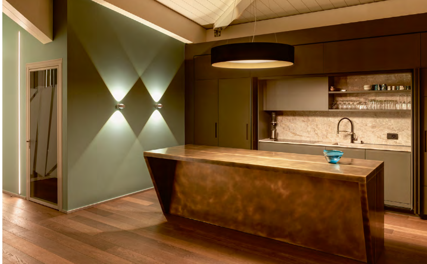
Les faisceaux lumineux clairement délimités sur le mur et l'élégante suspension STUDIO LINE au-dessus du bloc-cuisine s'intègrent parfaitement à l'architecture.