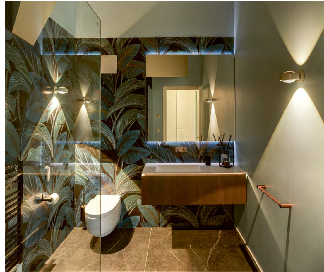
Une différence rafraîchissante: le papier peint Tropicque, les couleurs et la lumière se complètent parfaitement.

Pour être performant, il faut se sentir bien dans son bureau. Les stratégies New Work élaborent des concepts qui tiennent compte des besoins des collaborateurs afin de les concilier avec les objectifs de l'entreprise. L'éclairage y joue un rôle important. Fonctionnel et émotionnel.