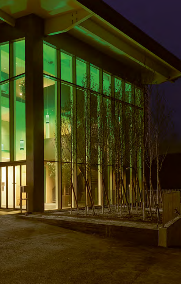
La lumière colorée dans le hall d'entrée renforce la trame claire de la division de la façade.